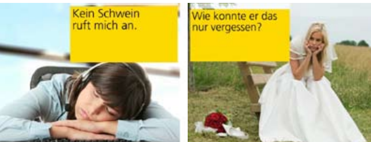
Wiener Schmah war gestern - Schweizer Humor ist heute!

einfach erledigt werden, dann sind Sie bei Schweizern an der richtigen Adresse. Wie gut also, dass seit kurzem die Swiss Post International Austria als größter Anbieter für den internationalen Mailingversand ihre Dienste auch österreichischen Unternehmen anbietet. Ob Direct Mailings, Tagespost, Zeitungen, Zeitschriften oder Kleinwaren – Sie können sich darauf verlassen, dass Sie keine bösen Überraschungen erleben.